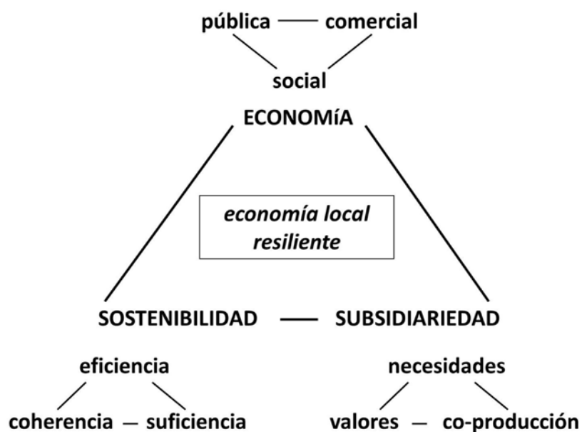
Fig. 2 – Los elementos para una economía local resiliente

y gestión de las interdependencias entre los diversos actores de la economía local.